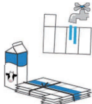
Hộp sữa giấy